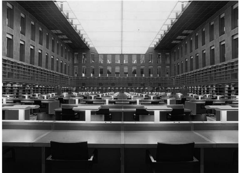
圖 7：德勒斯登大學圖書館新館閱覽空間

巴伐利亞邦立圖書館是 1558 年在巴伐利亞大公阿貝爾特五世捐獻的私人圖書館的基礎建立起來的，已有四百五十多年的歷史，是一個以收藏西方文化遺產為主的大寶庫，同時也是學術研究資源中心。該