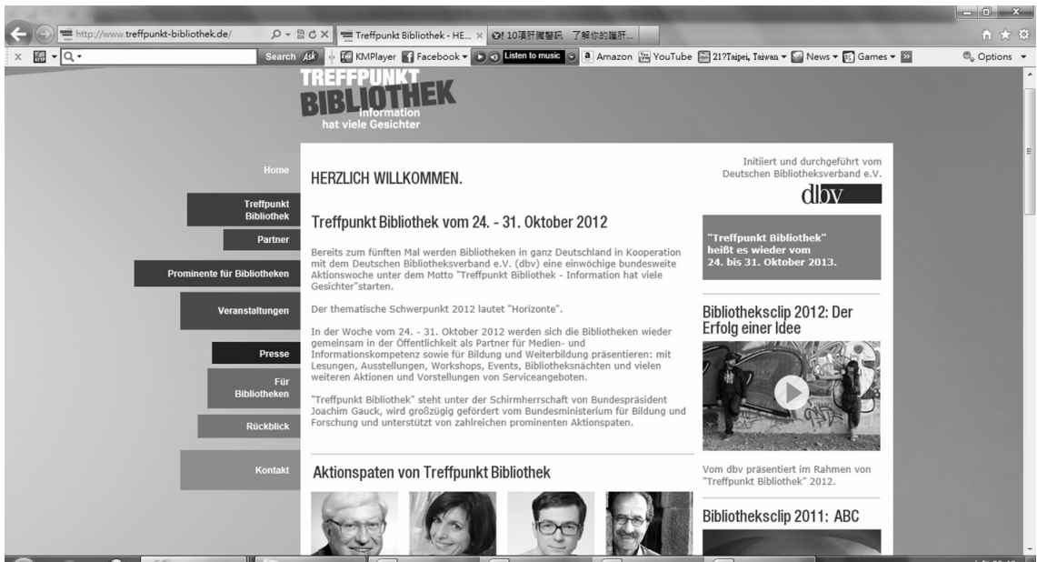
圖 4：德國圖書館週活動網頁（Deutscher Bibliotheksverband e.V.）