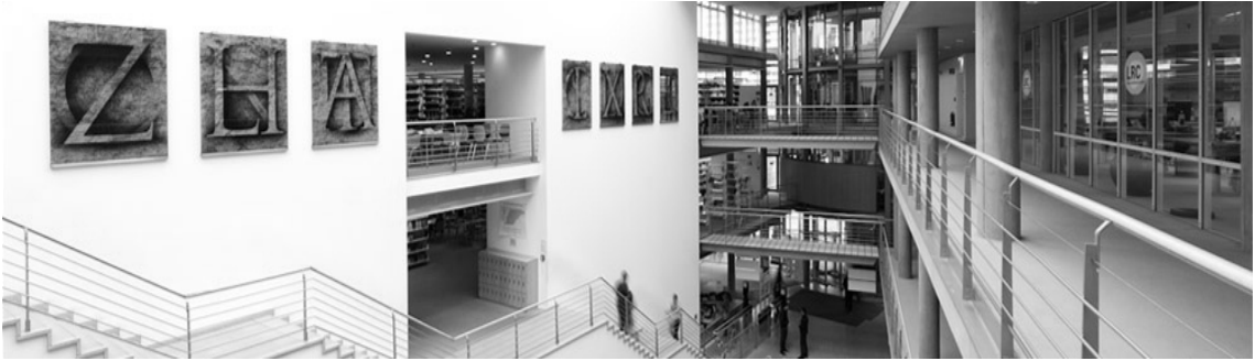
圖 5：哥廷根大學圖書館網站