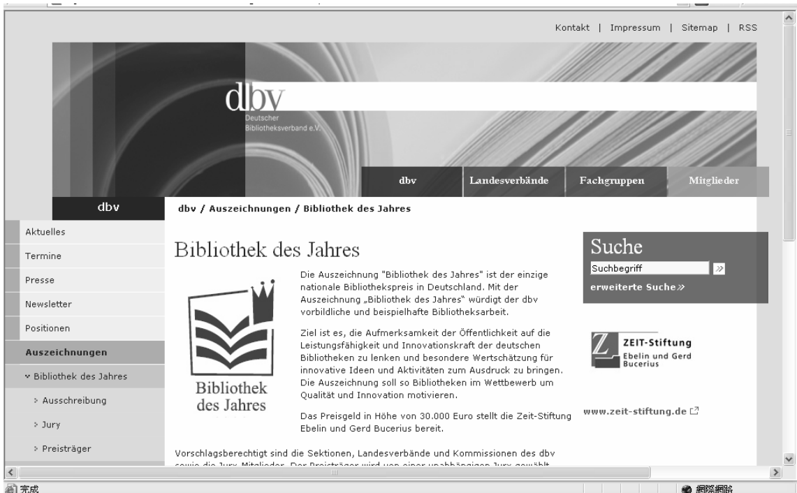
圖 2：德國年度圖書館獎活動網頁