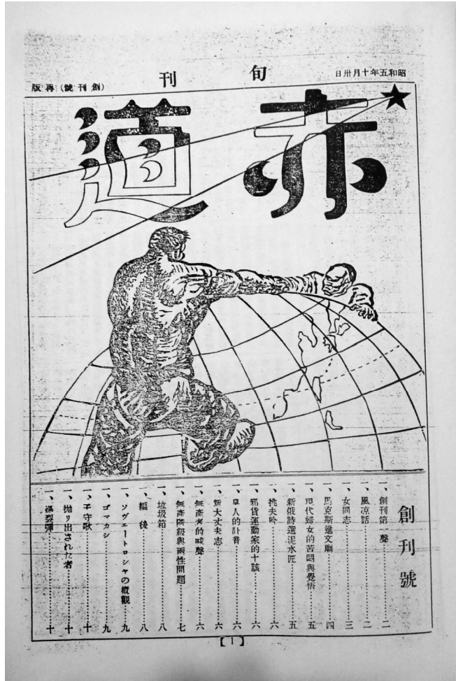
▲《赤道報》1930年10月創刊號