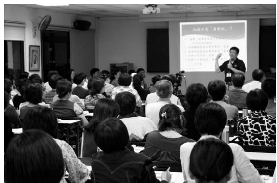
▲王藝逢導演於高雄場上課一隅