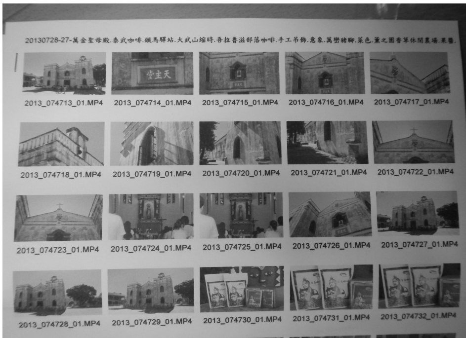
圖 2：圖示場記表（以拍攝檔案列印圖示）